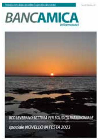
Foto di copertina "Belvedere"