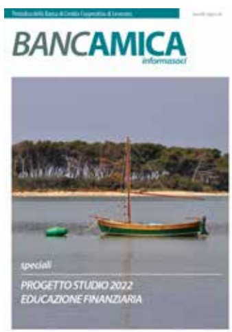
Foto di copertina "Isola dei Conigli"