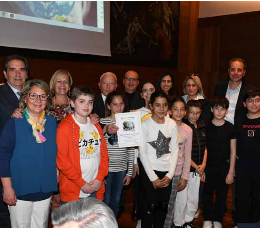
ISTITUTO TECNICO ECONOMICO "A. OLIVETTI" LECCE