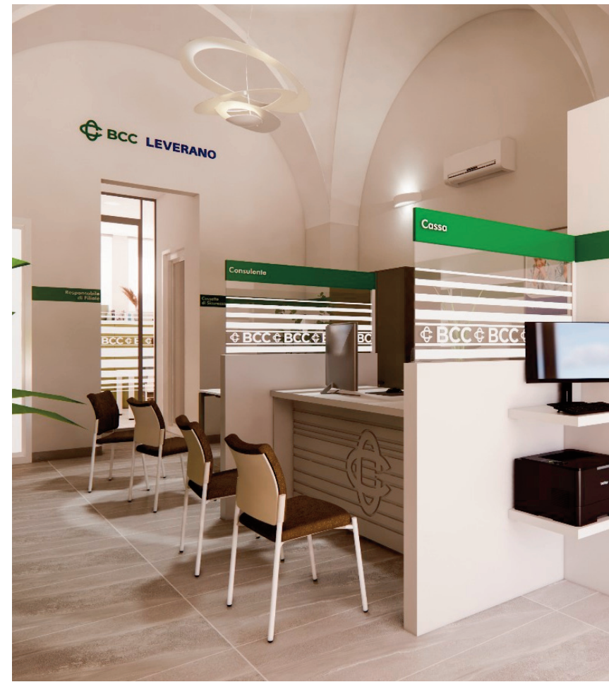
IN ALTO, VISTA INTERNA ED ESTERNA DELLA NUOVA FILIALE DI BCC LEVERANO A SUPERSANO. SOTTO, LA DISTRIBUZIONE DELLE SEDI NELLA PENISOLA SALENTINA.

Ruffano, Botrugno, Montesano Salentino, Nociglia e San Cassiano - per un'ulteriore area servita di circa 50 mila abitanti. La banca diventerà, con l'imminente apertura, un importante riferimento per i servizi bancari nel Salento, servendo ben 54 comuni e circa 600 mila abitanti residenti.